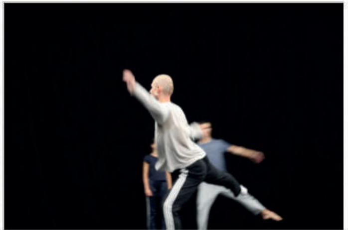
Se méfier des eaux qui dorment, répétitions

Le chorégraphe garde les passages les plus importants du Lac des Cygnes classique même s'il ajoute quelques transformations : dans les pas de deux, en gardant la règle du mouvement qui se transmet de l'un à l'autre, il y a quatre danseurs sur scène, seulement deux bougent ; la danse des quatre petits cygnes est statique et marquée seulement par l'accentuation à l'unisson du souffle des interprètes, la danse espagnole (Fandango) est maintenue.