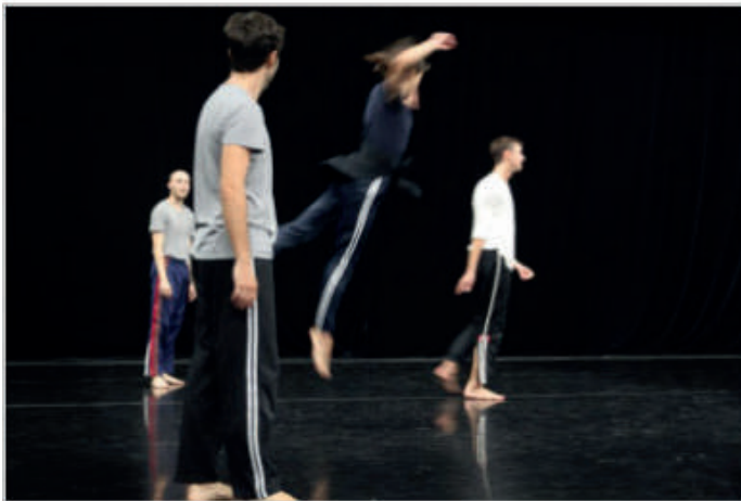
Se méfier des eaux qui dorment, répétitions